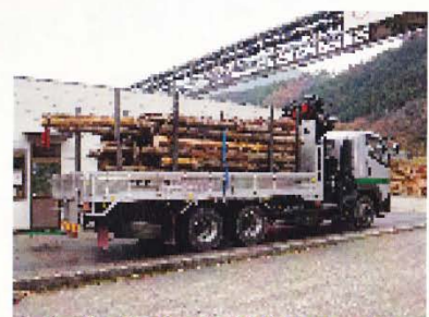
◆金山チップ 運搬トラック◆