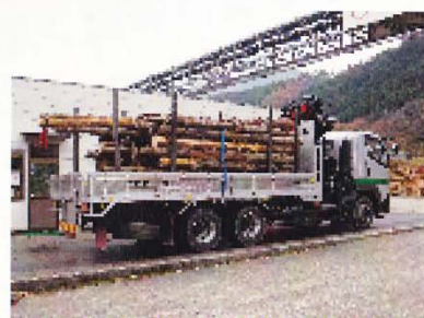
◆金山チップ 運搬トラック◆

編集後記 本年も残りわずかとなりました、設立から現地研修、出荷とあつと3ヶ月余が過ぎました、皆様のご協力によりまして多くの出荷ができました事にお礼を申し上げます。来る2014年皆様、活動組織にとりまして良い年となることをご祈念申し上げます。 「木の駅」INつぼがわ活動組織事務局