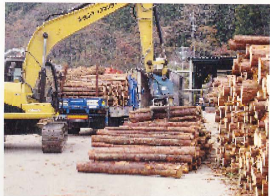
積み込み2時間、降ろすのにたった15分

当初は15~20%減程度は覚悟をしていま したが好結果が得られました。 出荷者皆様方の検尺は控えめに が巧を奏したのかなと思います。 検尺はあくまでも控目に今後とも お願いします。