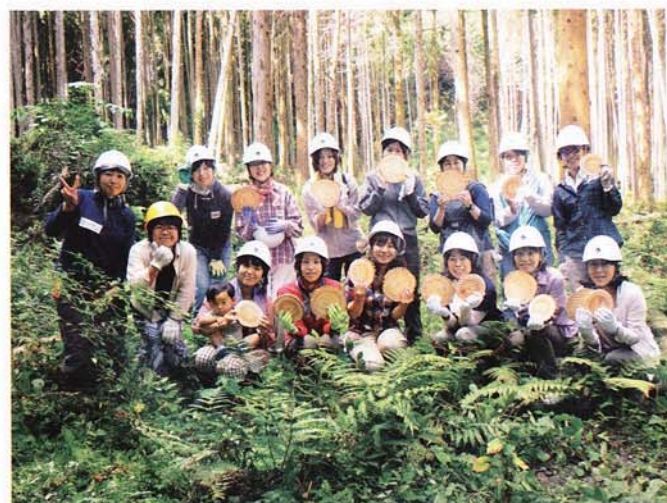
▲旭木の駅女子部主催の間伐イベント。女性ならではの柔らかな感性で、活動を支えはじめた

事情を知る彼女らはまず、運営資金や補填金を賄うために、一口1000円の寄付金を呼びかけた。次に間伐材から葉 しおり を作って販売した。夏には子どもたちの間伐体験を開催し、特別に1枚1000円のを可愛い子供 Mori 券まで発行した。商店探訪をして特産商品発掘に乗り出したりと、女子たちが柔らかな感性で木の駅を支えはじめた。