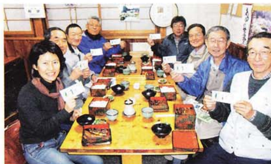
▲出荷で得た Mori 券を手に楽しい一時を過ごす「とよた旭高原山楽会」のみなさん