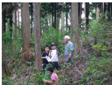
山をお手入れして、 (子どもたちが 森の健康診断中)